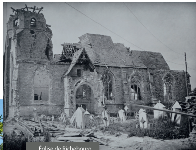
Église de Richebourg en 1915