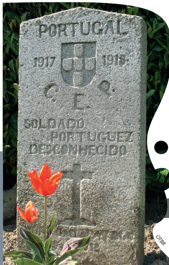
Tombe d'un soldat portugais inconnu