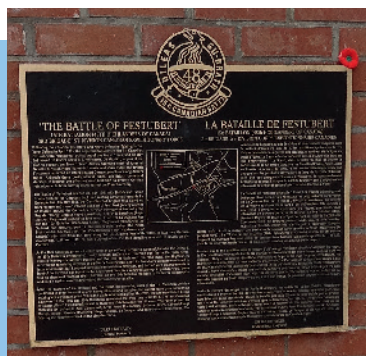
Stèle commémorative canadienne située au croisement des rues de Lille et du Taillis à Festubert (E. Roose)

En 1914, les Canadiens répondent en nombre à l'appel au volontariat pour la guerre. Le gouvernement décide donc de former un corps expéditionnaire d'une division, formée de trois brigades et de douze régiments d'infanterie. Les premiers engagements ont lieu vers Ypres. Lors de la bataille de Festubert, la division canadienne est engagée à partir du 18 mai 1915. La 3 e brigade attaque un petit verger en face du village de Festubert et la 2 e brigade est engagée plus au sud. Les combats provoquent la perte de plus de 2000 hommes. Ce monument commémoratif en l'honneur du 15 e bataillon du 48 e Highlander de Toronto, au Canada, a été inauguré dans le secteur de l'ancien verger.