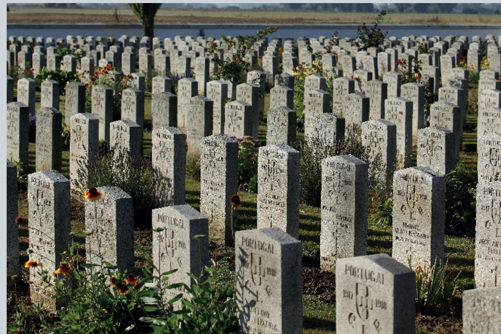
Cimetière militaire portugais de Richebourg

Si le labeur des agriculteurs a aujourd'hui effacé l'essentiel des stigmates du conflit – à l'exception d'un grand nombre de blockhaus allemands – la mémoire de la Première Guerre mondiale reste puissamment présente dans un paysage bocager parcouru par un lacs de routes qui serpentent en suivant le tracé des fossés de drainage : nombreux cimetières britanniques et allemands, lieux de mémoire portugais, magnifiques mémoriaux érigés en souvenir des soldats disparus, qu'ils soient indiens, à Neuve-Chapelle, ou britanniques, au Touret.