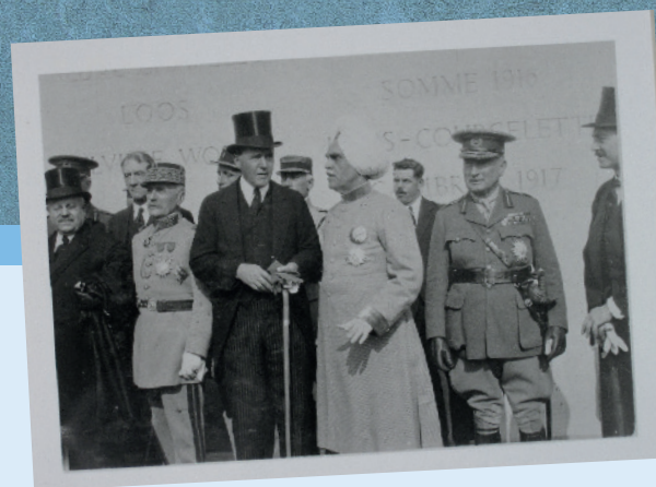
Léon Perrier, Ministre des colonies, le Maréchal Foch, Lord Birkenhead, Secrétaire d'État britannique pour l'Inde et le Maharajah de Kapurtala participant à l'inauguration du mémorial en 1927 (ADPc 4Fi3411)

Le 28 octobre 1914, l'armée britannique engage son corps indien dans le village qui reste finalement aux mains des Allemands. Le 10 mars 1915, la 1 re Armée britannique souhaite le reconquérir, prendre la crête d'Aubers et ouvrir la route de Lille. Le front d'attaque s'étire, depuis l'emplacement du mémorial indien, sur trois kilomètres vers le nord. Les Britanniques mobilisent 340 canons et deux corps d'armée, soit près de 40 000 hommes. Après 35 minutes de bombardement, le corps indien s'élance contre les tranchées situées face à l'actuel mémorial.