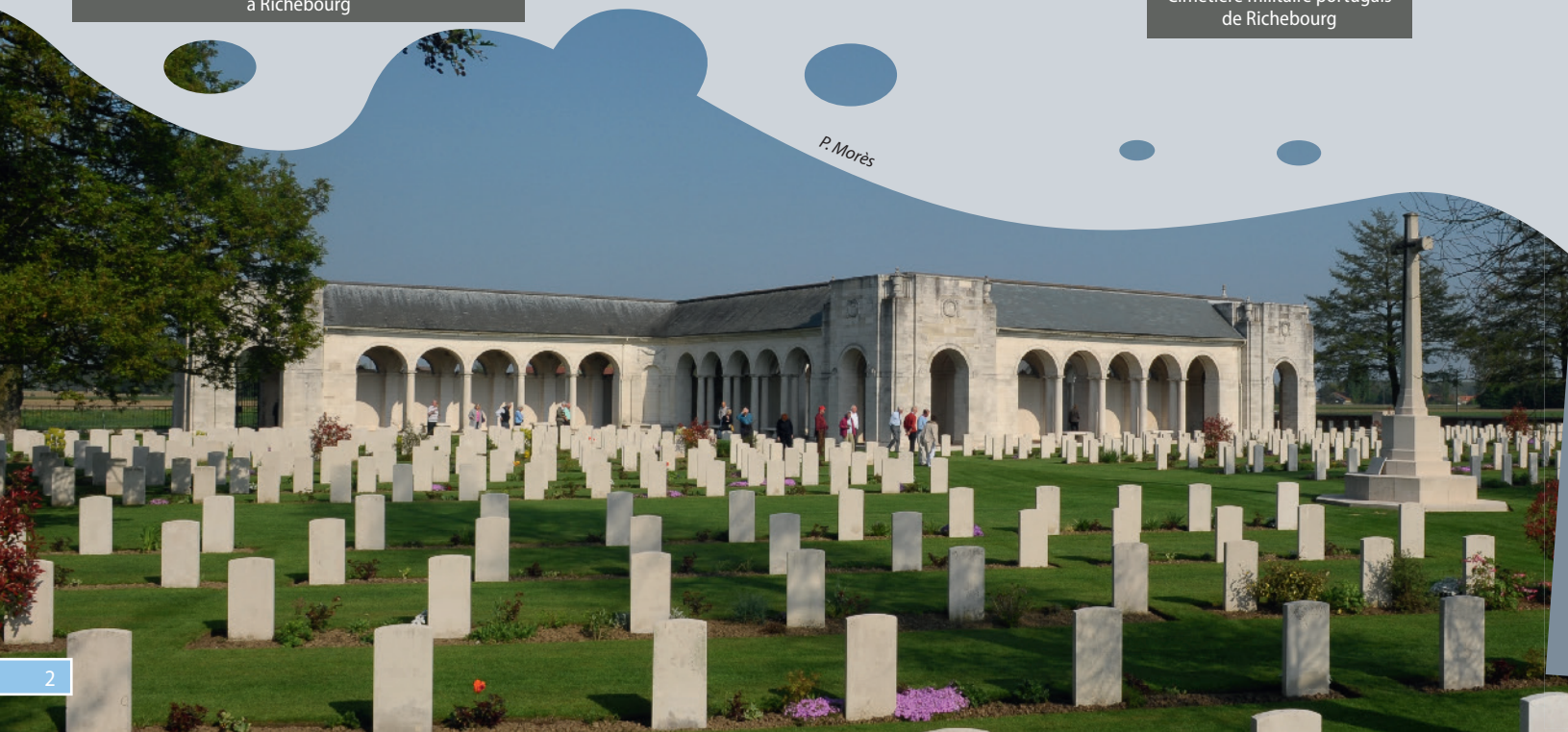
Le Touret Military Cemetery and Memorial à Richebourg